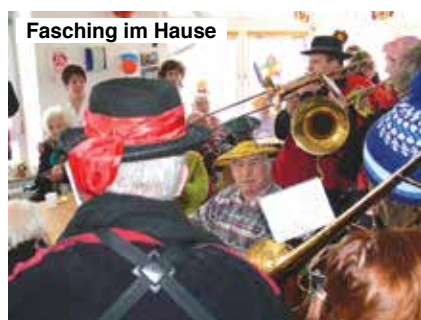
Fasching im Hause