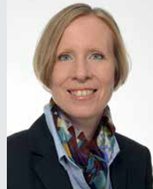
Stefanie Bürkle Landrätin des Landkreises Sigmaringen

Landratsamt Sigmaringen Leopoldstraße 4 72488 Sigmaringen